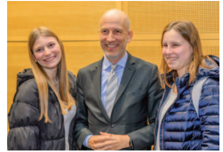
Arbeits- und Wirtschaftsminister Martin Kocher nahm sich für alle Fragen Zeit.