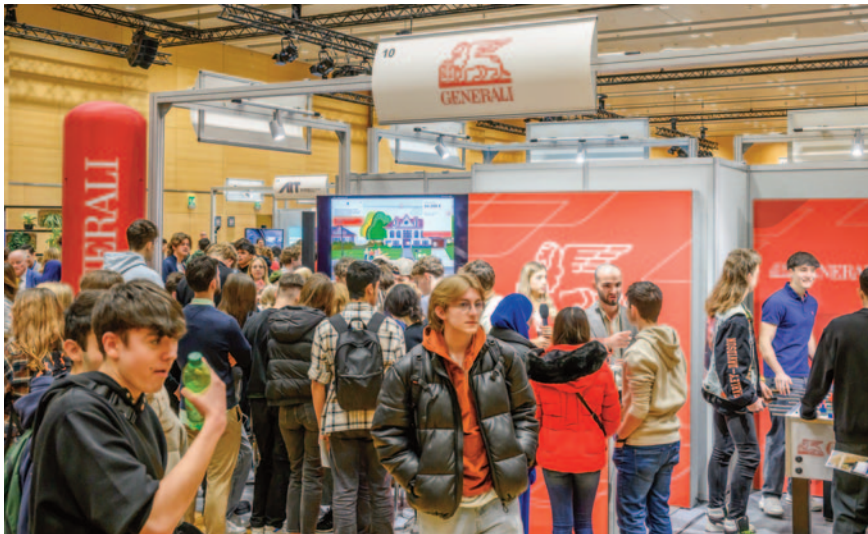
Starker Andrang herrschte am Stand der Generali, wo wie bei jedem Aussteller auch Vorträge für im Voraus angemeldete Schulklassen stattfanden.