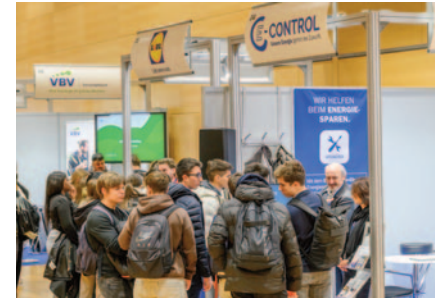
VBV, Lidl und E-Control zogen mit ihrem informativen Angebot die Schüler an.