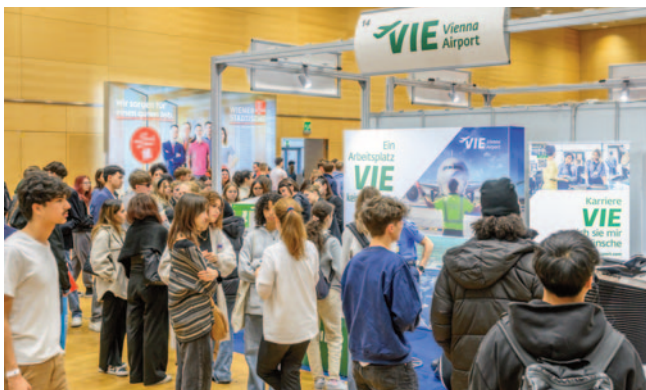
Der Flughafen Wien präsentierte sich nicht nur als potenzieller Arbeitgeber, sondern faszinierte auch mit einem VR-Flugsimulator.