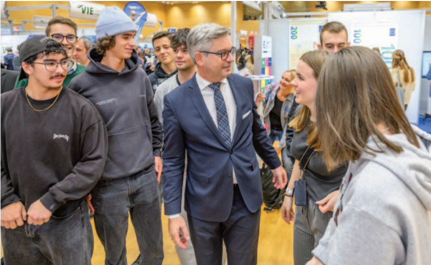
Finanzminister Magnus Brunner wurde von den Schülern auch nach seinem Vortrag noch mit Fragen konfrontiert, die er nicht offenließ, sondern alle beantwortete.