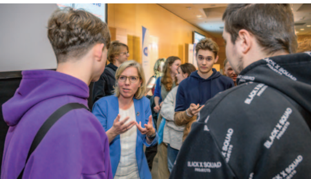
Ministerin Leonore Gewessler nahm sich nach ihrem Podium für alle Schüler und deren Fragen genügend Zeit.