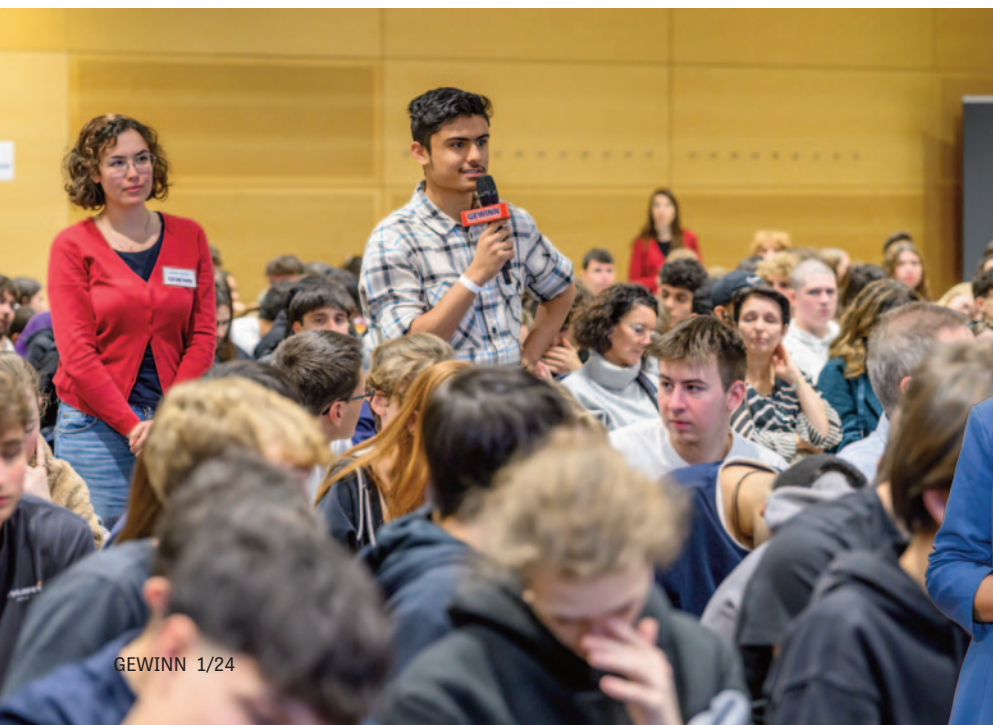
Über 800 Schüler applaudierten minutenlang, als Ministerin Gewessler den Saal betrat. Trotzdem wurden kritische, aber konstruktive Fragen vom Publikum gestellt – die auch detailliert beantwortet wurden.