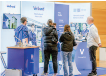
Am Verbund-Stand wurden alle Fragen zum Thema „grüne Energie“ beantwortet.