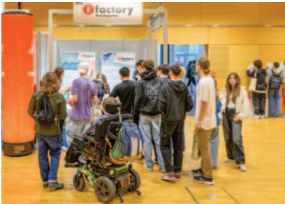
Das Jugendmarketing-Institut tfactory interessierte die Jugend.