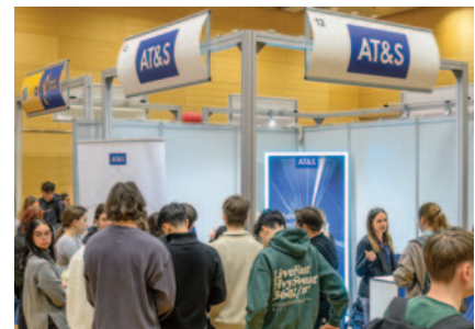
Mikrochips und Halbleiter sind für das halbe globale BIP verantwortlich, dementsprechend war der Run auf AT&S groß.