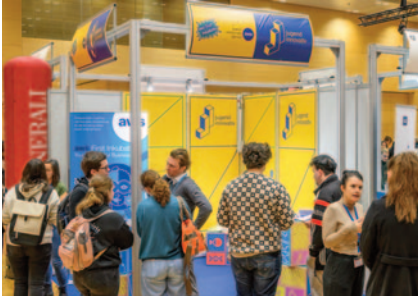
Am Stand von aws ging es u. a. um alles über Förderungen bei Firmengründung.