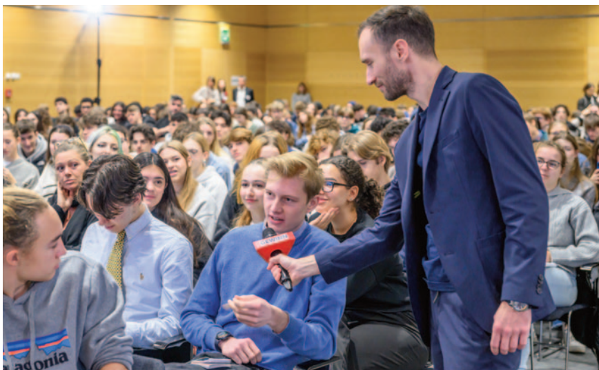
Nirgendwo sonst als auf dem GEWINN InfoDay können Schüler ihre Fragen an Minister, CEOs und Topexperten direkt im persönlichen Gespräch und ans Podium stellen.