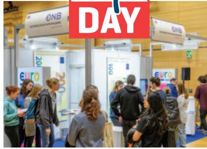
Bargeld, digitaler Euro, Goldreserven – die Nationalbank beantwortete alle Fragen.