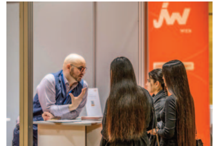
Alles zu den Themen Jungunternehmen und Vernetzung im Unternehmensumfeld gab es bei der Jungen Wirtschaft Wien.