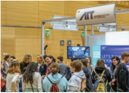
Ob HAK, HTL oder AHS, das Forschungsinstitut AIT wurde regelrecht gestürmt.