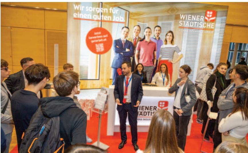
Sehr gelungene Kurzpräsentationen am Stand der Wiener Städtischen vor den angemeldeten Schulklassen.