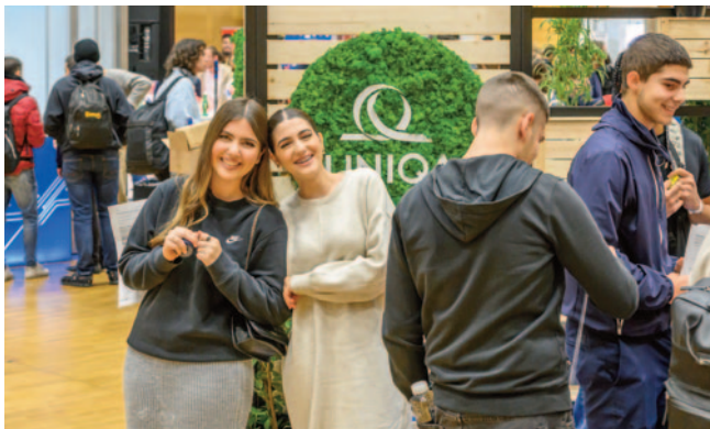
Am Stand der Uniqi herrschte durchgehend gute Laune, wobei der Infotransfer nicht zu kurz kam.