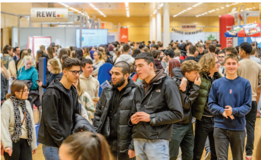
Über 5.000 Jugendliche und ihre Lehrkräfte aus allen Bundesländern waren beim InfoDay 2023, Österreichs größtem Wirtschaftskongress für Schüler ab 16 Jahren, dabei.