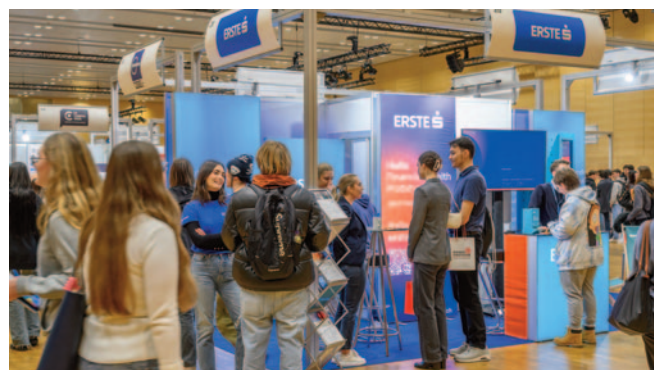
Interessante Geldthemen, KI und Financial Literacy waren am Stand der Erste Bank im Fokus.