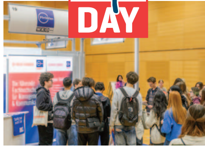
Die FH der WK Wien wurde von potenziellen Studierenden ausgiebig befragt.