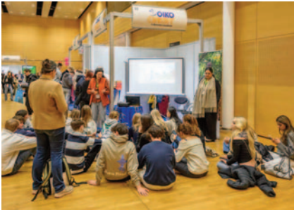
Sehr interessante Vorträge hielten die Experten am Stand der Oikocredit.