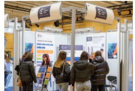
Die FH Campus Wien präsentierte ihr umfangreiches Studienangebot.