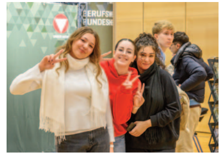
Auffallend viele Frauen interessierten sich für den Dienst und die Ausbildungsmöglichkeiten beim Bundesheer.