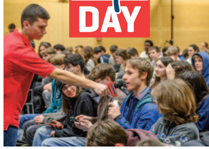
Die Teilnehmer brachten sich aktiv ein und stellten viele gute Fragen.