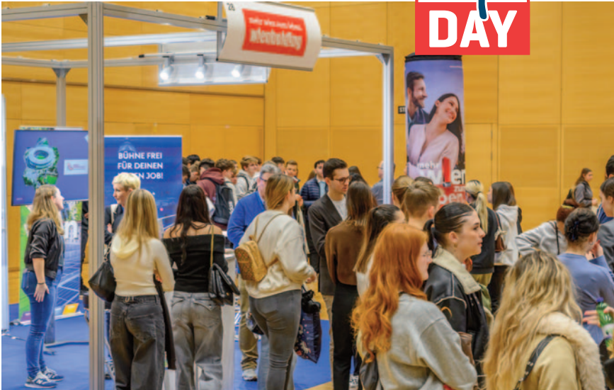
Viele interessante Jobangebote präsentierte die Wien Holding.