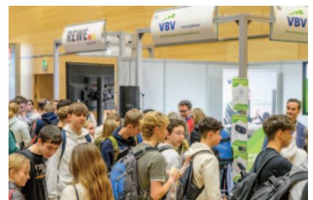
Rewe und VBV waren starke Schülermagnete.