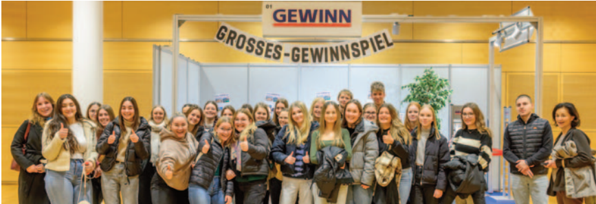
Das große GEWINN-Gewinnspiel: Sehr großer Andrang, nicht zuletzt aufgrund der attraktiven Preise – die Gewinner werden in der Februar-Ausgabe bekannt gegeben.