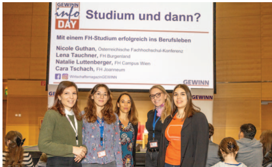
Alles über ein FH-Studium erfuhren die Teilnehmer von den oben im Foto angeführten Vertreterinnen der Fachhochschulen.