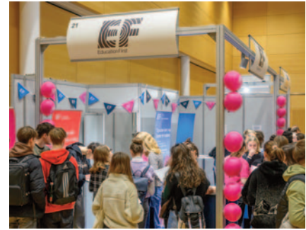
EF Sprachreisen wurde auch in diesem Jahr wieder von den Schülern gestürmt.