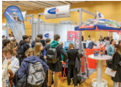
AMS: seit Jahren immer ein Anlaufpunkt für die Schüler mit Infos zum Arbeitsmarkt.