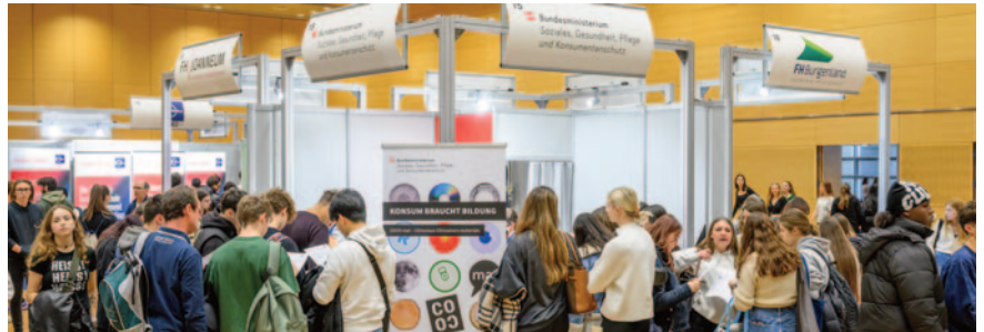
Ob Fachhochschulen, Ministerien, Banken oder Versicherungen, auf dem GEWINN InfoDay fanden sich auch heuer wieder zahlreiche Unternehmen quer durch die Branchen ein.